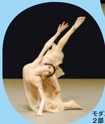
モダンダンス・ 2部(児童の部)