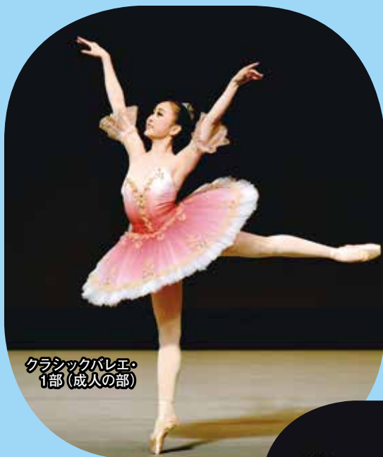
クラシックバレエ・ 1部(成人の部)