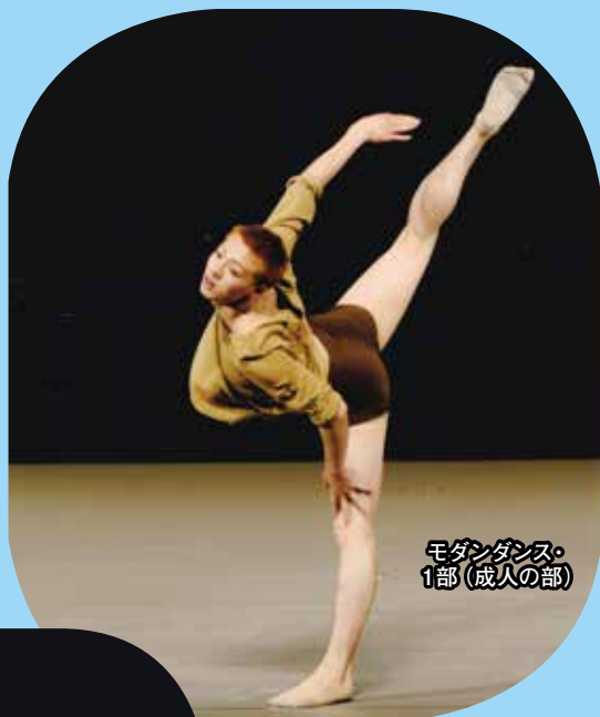
モダンダンス・ 1部(成人の部)