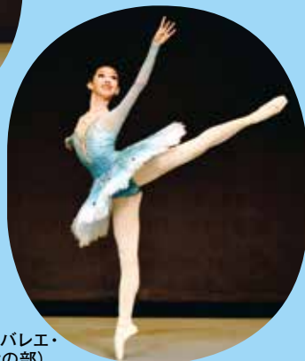
クラシックバレエ・ 2部(児童の部)