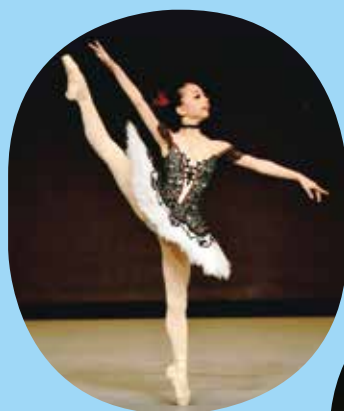
クラシックバレエ・ ジュニア部