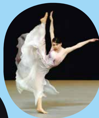
モダンダンス・ ジュニア部